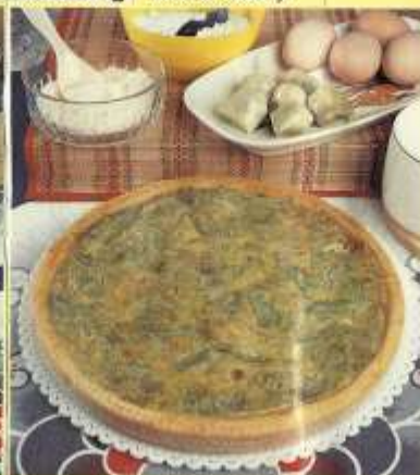
Torta di carciofi