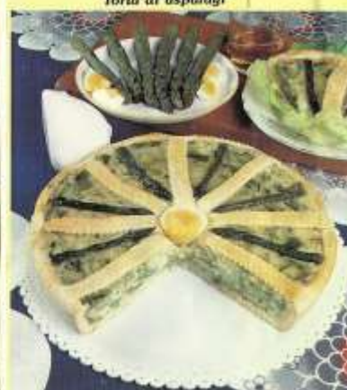
Torta di asparagi