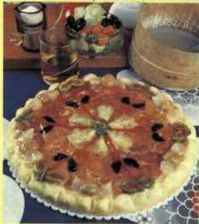
Torte salate 9,50 al kg