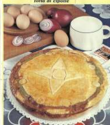
Torta di cipolle