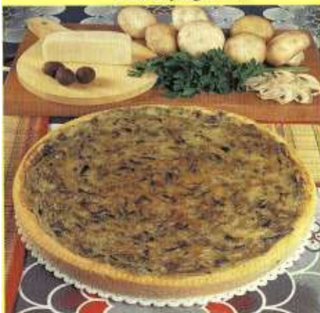
Torta di funghi